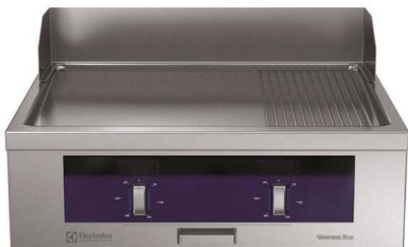
589107 (MCHOABHOAO) Stekhäll, el, med slät och räfflad kromhäll, betjänas från 1 sida med hög bakkant, helmodul